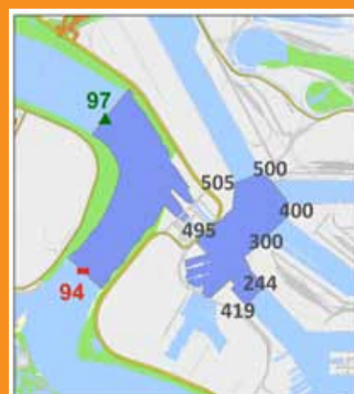
AIS-controlezone Boudewijn-Van Cauwelaertsluis